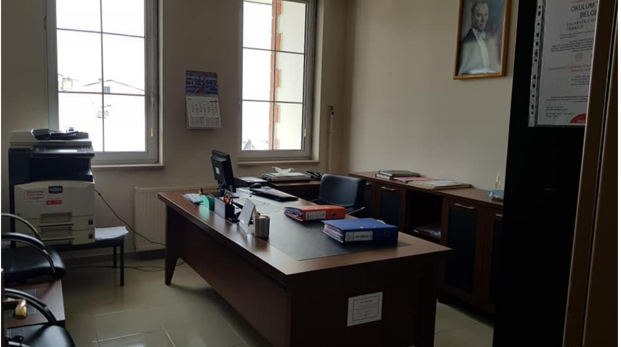
Müdür Yardımcısı Odası

Merkezimizin kurs binası ise resmen herhangi bir işlem yapılamamakla birlikte Pazaryolu anaokulu binasının 2. Katında bulunmaktadır. Bu bina içerisinde 4 sınıfı ve 1 adet depo bulunmaktadır.